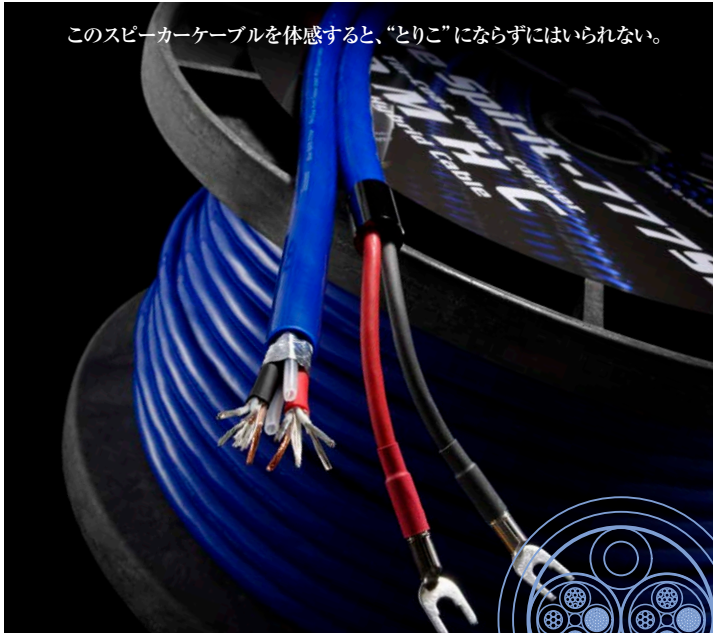
このスピーカーケーブルを体感すると、“とりこ”にはならずにはられない。

ひたすら迫真の鳴りっぷりを追究したケーブル、Blue Spirit 777シリーズが登場します。