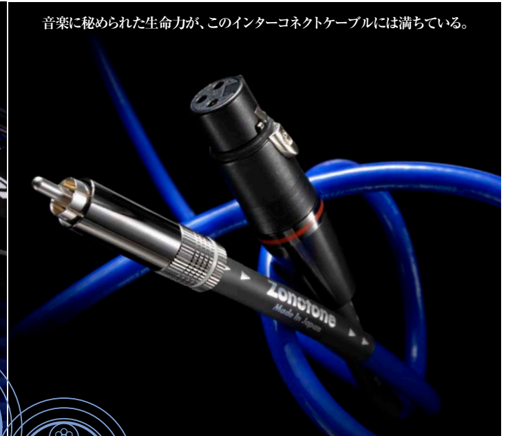
音楽に秘められた生命力が、このインターコネクトケーブルには満ちている。